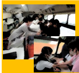
献血セミナー 5年生